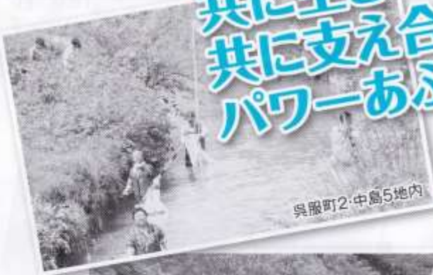
呉服町2・中島5地内