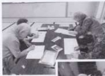
漢字のパズル (漢字の宝島)