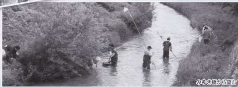
みゆき橋から望む