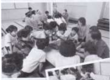
木製パズル (ジエンガ)