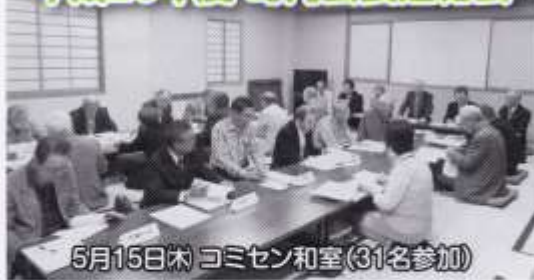
5月15日(木) コミセン和室 (31名参加)