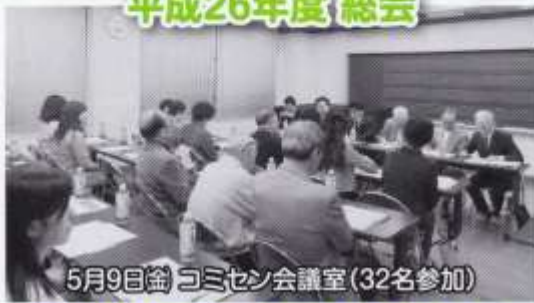
5月9日(金) コミセン会議室 (32名参加)