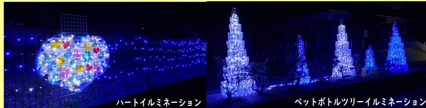
ハートイルミネーション