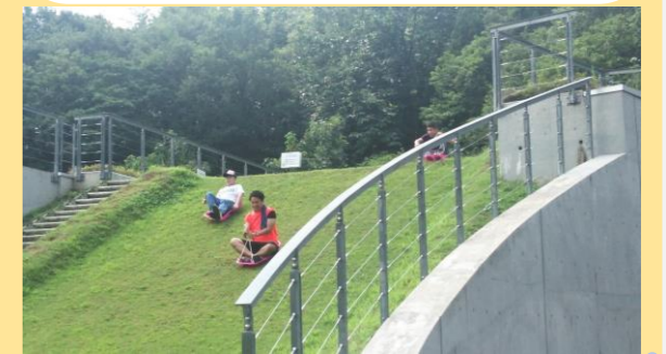
丘陵公園里山ツアー＆海ドライブ

夏休みのドライブで丘陵公園の里山に行ってきました！芝のソリをしたり、カブトムシハウスでカブトムシを見たり触れたり自然に触れる経験がたくさんできました(^) 午後からは出雲崎にある天領の里へ行き、みんなで海に入りました☆ 天候に恵まれとても良い1日になりました！