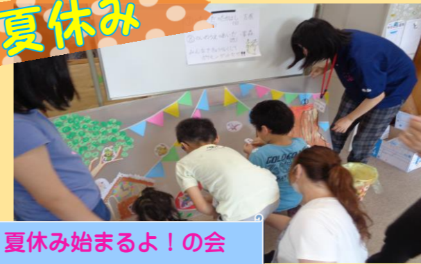
夏休み始めるよ！の会

夏休み始めるよ！の会を行いました！今年にはピュアは一と館内で行いました。午前中は飾り付けの準備、午後からは歌にのせて握手で自己紹介、猛獣狩りゲーム、巨大ジェンガで大賑わい！最後は宝探しを行い、お宝（ポケモンのイラスト）を貼り付け、みなさんと1枚の絵を完成させました。完成させた絵は2階に飾ってあります♪