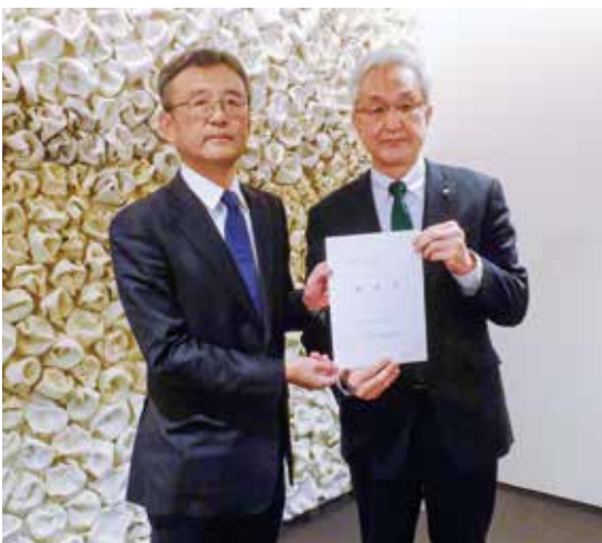
令和4年12月26日に本田会長が磯田市長へ要望しました。